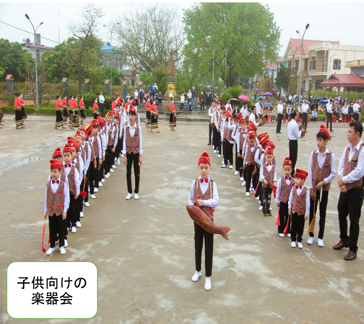
子供向けの 楽器会