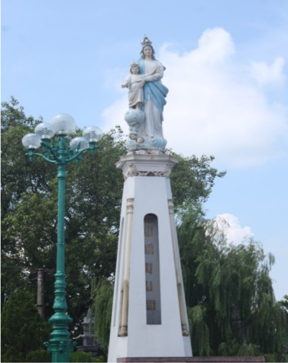
• 母マリアの像（ 外側）