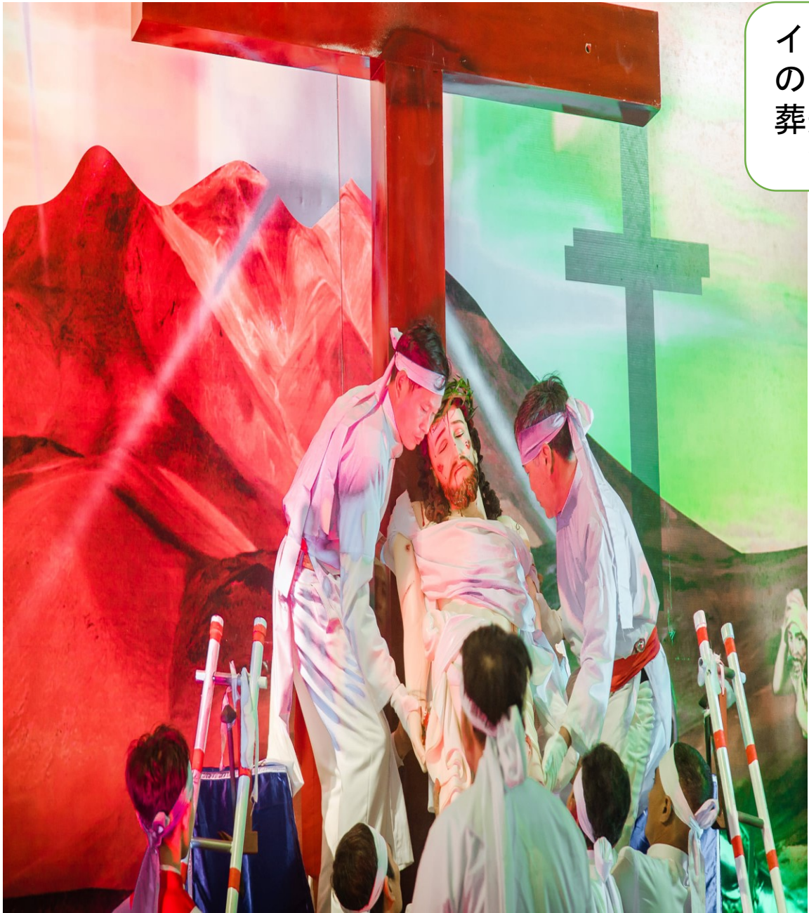
イエス様の死体を葬送する背景